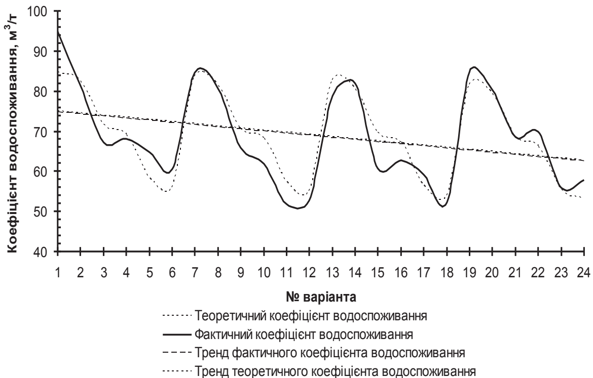
Рисунок 2. Теоретичні та фактичні коефіцієнти водоспоживання цибулі ріпчастої

ндартне відхилення (табл. 2), лінії тренду (рис. 2) теоретичного та фактичного коефіцієнту водоспоживання цибулі ріпчастої приблизно однакові, що також підтверджує достовірність отриманого рівняння.