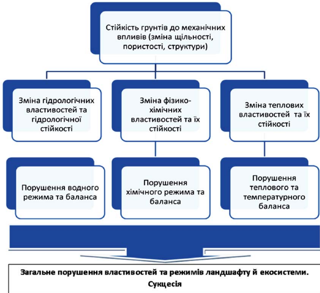
Рисунок 2. Структурна схема негативних чинників впливу на стійкість до механічного впливу на функціонування екосистеми зрошуваного землеробства

зрошуваних ґрунтів призводить до їх переущільнення, зокрема, до формування, так званої «плужної підшви».