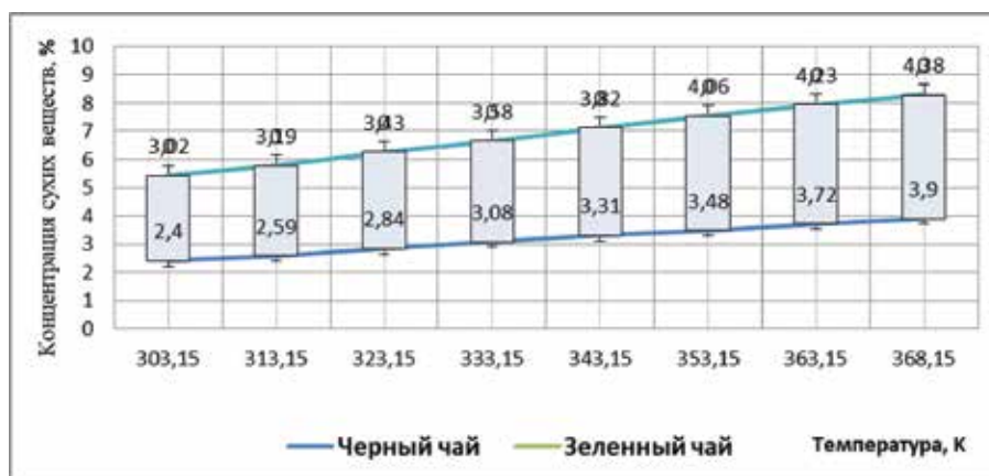
Рис. 1. Зависимость содержание массовой доли сухого вещества в экстракте черного и зеленого чая от температуры

Математическая модель зависимости концен-