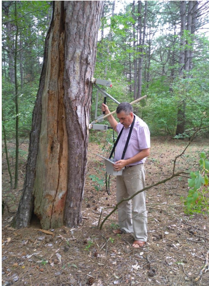
Рис. 5. Зондування георадаром ЛОЗА-М стовбура сосни кримської, пошкодженого блискавкою