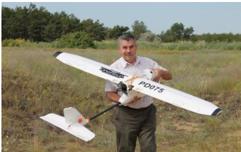
Рис. 1. БПЛА за літаковою аеродинамічної схеми на платформі PD075, підготовка до запуску

У період липень-серпень 2018 р. над лісовими насадженнями Дослідного лісництва ДП «СФ УкрНДІЛГА» було проведено випробувальні польоти крилатого БПЛА за літаковою аеродинамічною схемою на платформі PD075 (Рис. 1).