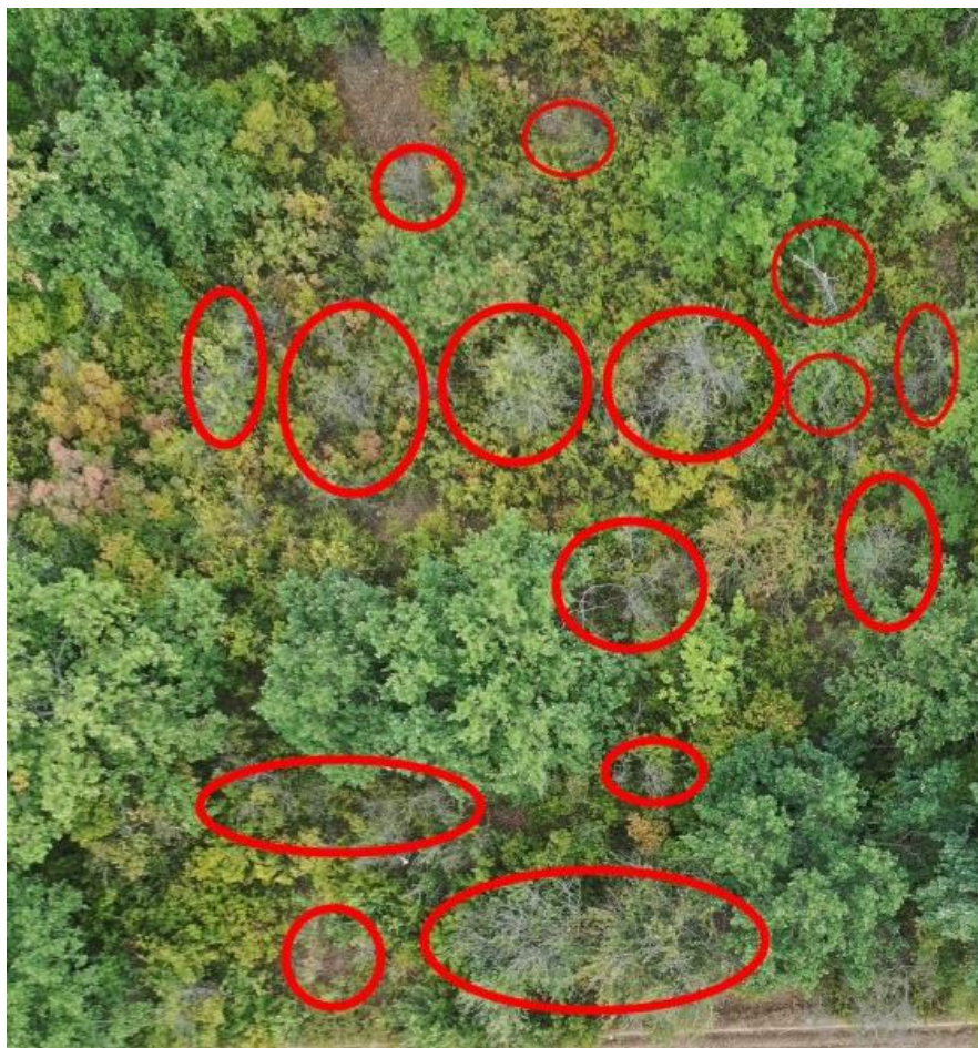
Рис. 3. Ділянка лісопарку на околиці с. Антонівка, із всохлими вершинами та окремими скелетними гілками (вересень 2019 р.).