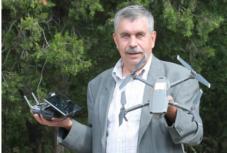
Рис. 2. Пульта керування БПЛА та безпілотною гелікоптерного типу перед запуском

Квадрокоптер дає змогу оцінити патологічні зміни, а саме: дихромацію, дефоліацію чи всихання в різних ярусах крони дерева (рис. 3).